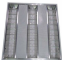
LED inleg Armatuur